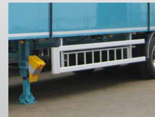
Klappbarer Seitenanfahrerschutz mit Alu-Leiter