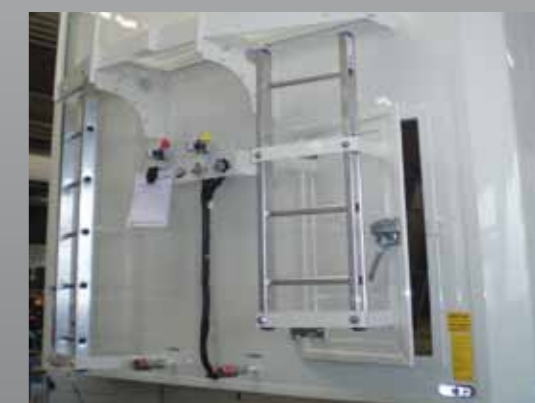
Tür in Stirnwand