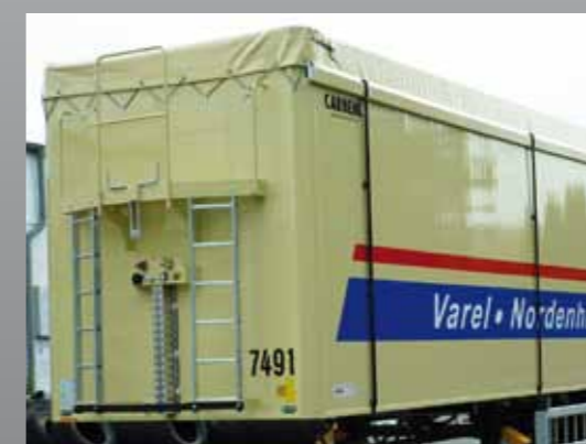
Podest mit beidseitigem Aufstieg