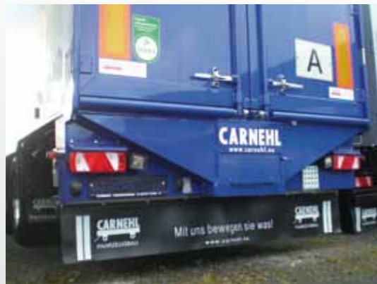
Heckabschluss mit integriertem Auslaufrichter