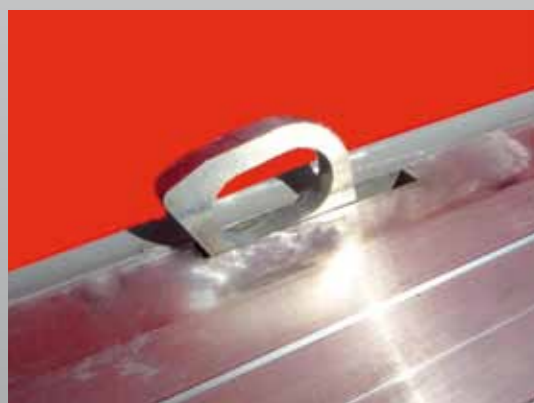
Klappbarer Zurring getreidedicht