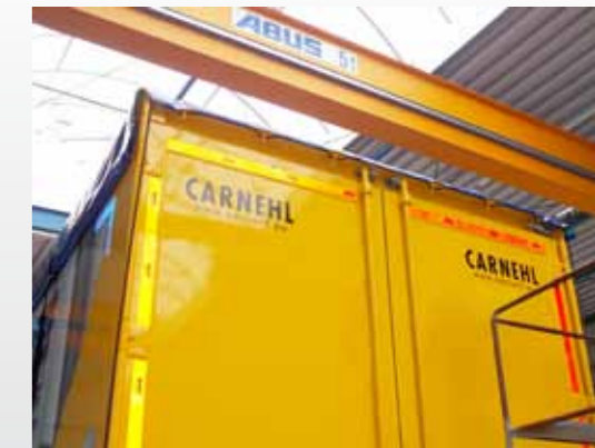
Schwenktraverse für Kranbeladung (optional)