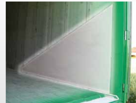
Seitenwand - Verschleißblech