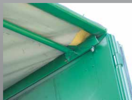
Klappbarer Endspiegel (Standardausführung)