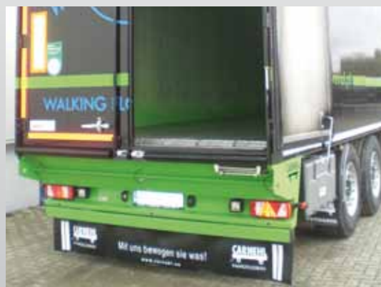
Heckschürze mit Lampen-Schutzklappe