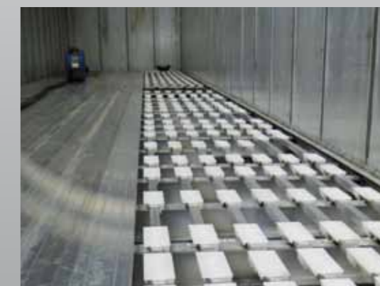
Bodengruppe durchgehend längsverstärkt